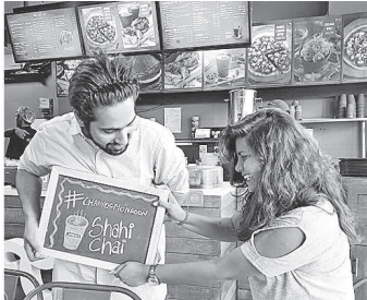
(Top) At Chaayos, millennials constitute over half the customer base; (Bottom) Chai Point has a special product for office goers, among its biggest consumers

The tea retailers say that in this sense, there is little to do to increase awareness about its use and benefits. However, enhancing the tea drinking experience can reap big rewards. Backing their expectations is a Nielsen study on consumer behaviour ( Moving on , December 2016). It says: "The most successful premium products are those that perform an important job